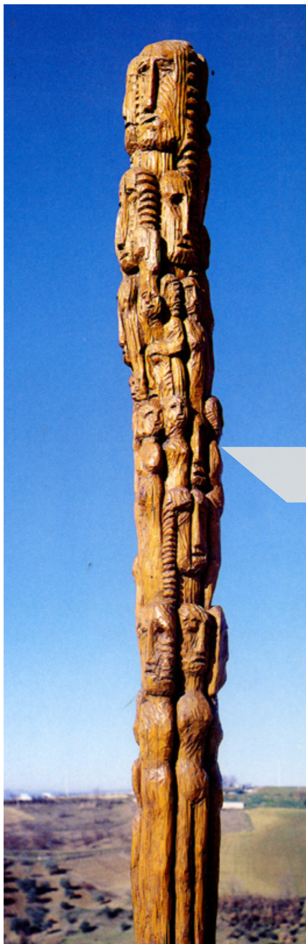
▲ Divinità della terra , 1969, legno di castagno patinato, cm.235x20x20 ▼ Stele di Metaponto-Tracce di un alfabeto , 2007, legno di pioppo, cm.220x25x15