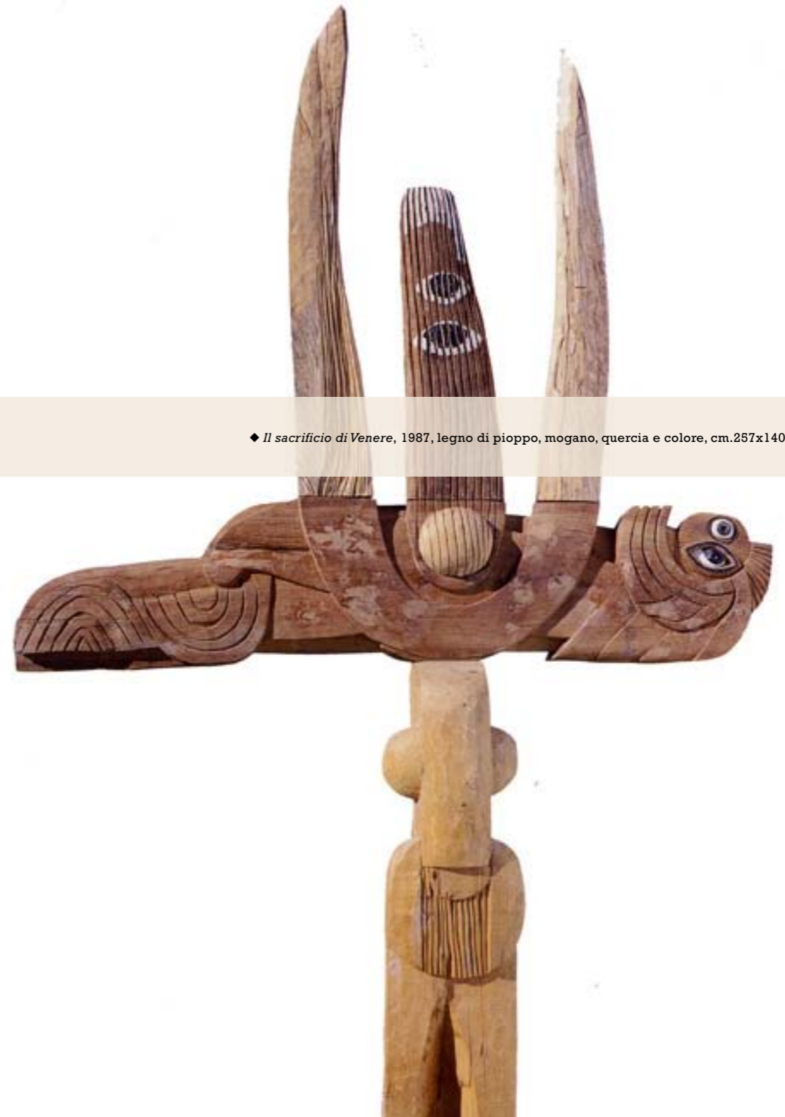
◆ Il sacrificio di Venere , 1987, legno di pioppo, mogano, quercia e colore, cm.257x140x20