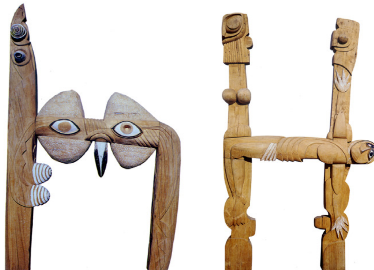
▲ La porta degli dei lucani , 1969, legno di quercia, cm.260x165x30 ▼ Deposizione , 1988, legno di pioppo, cm.240x100x25