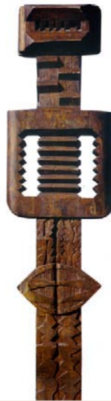
▲ Totem , 1979, legno di pino patinato, cm.250x55x15 ◀ Pane degli antenati , 1998, legno di cerro patinato e colore, cm.255x40x10 ▼ Portatrice di pane , 1991, legno di cerro patinato, cm.200x100x20