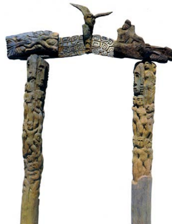
▼ Gea feconda Venere , 1985, legno di pioppo, pino e colore, cm.240x150x22