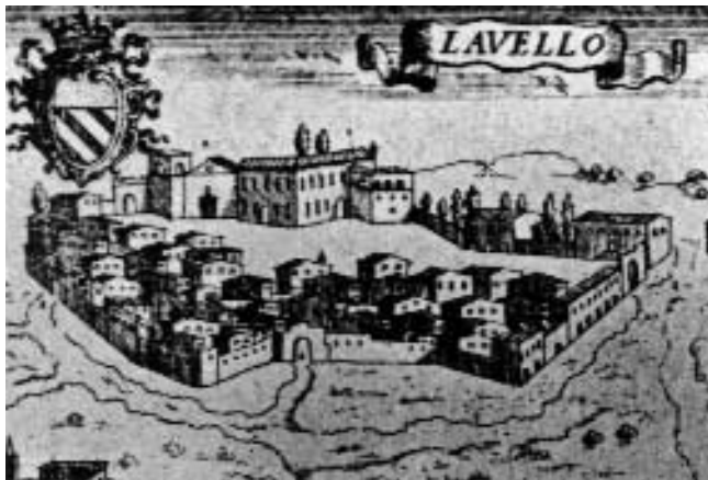
Lavello: veduta seicentesca dell'abitato e della Cattedrale (particolare) (Da G.B. Pacichelli, Il regno di Napoli in prospettiva , Napoli - 1703)

Notevoli trasformazioni ha subito la cattedrale nel corso del XX secolo. Nell'anno 1908 è stato trasformato il sagrato davanti all'ingresso, mentre la scalinata centrale di accesso è stata trasformata in una doppia gradinata a bracci laterali. Nel 1930, dopo il terremoto che funestò la zona del Vulture, è stata ricostruita la volta della navata centrale. Nel 1962, in occasione di altri lavori di restauro, sono stati rimossi il presbiterio in marmo, il baldacchino, il trono vescovile ed anche il seicentesco coro ligneo voluto nel 1623 dal vescovo Placido Padiglia 26 . Le ultime trasformazioni risalgono al 1986. In tale occasione è stato rifatto il pavimento della navata centrale e sono stati staccati gli intonaci ottocenteschi di quattro cappelle. Tali lavori sulle pareti hanno messo in luce, in alcuni pilastri e sugli archi delle cappelle, materiale archeologico di riutilizzo proveniente dal sito romano di Forentum , della contrada Gravetta, ed alcuni affreschi settecenteschi con immagini di santi. Attualmente nella seconda cappella a sinistra è stato sistemato un artistico sarcofago in pietra calcarea ri-