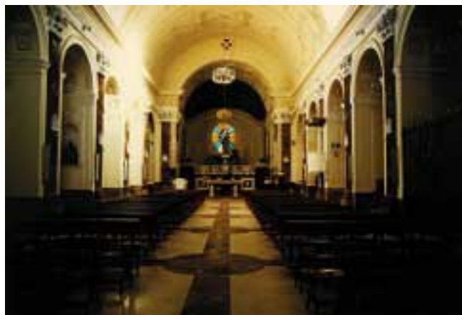
Lavello: chiesa di San Mauro, navata centrale (Foto A. Rosucci - 1999)

Dopo i lavori di restauro, l'aspetto della ex cattedrale di Lavello cambia profondamente. Nel pavimento della navata centrale, ad esempio, scompaiono alcune pietre tombali (come quella del vescovo France-