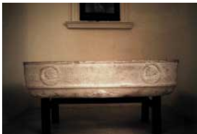
Lavello: chiesa di San Mauro, sarcofago del 1550