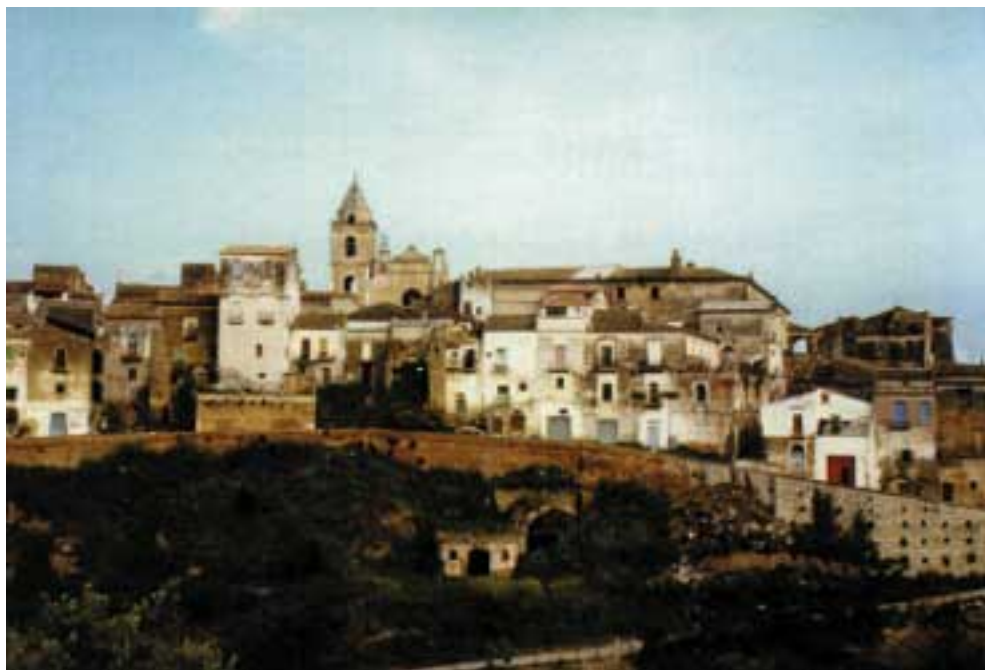
Lavello: panoramica dell'abitato medioevale e della Cattedrale