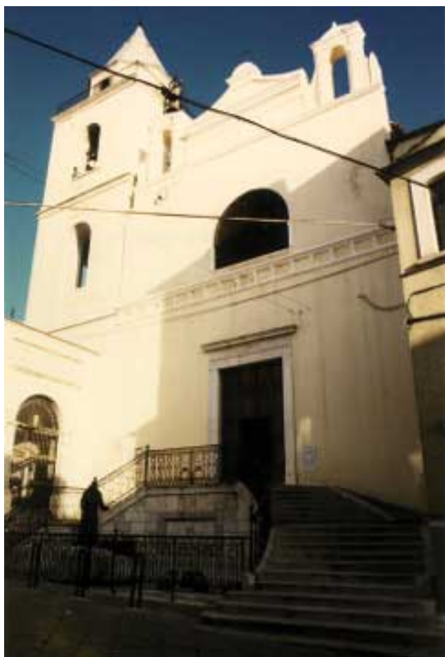
Lavello: ex Cattedrale di San Mauro, facciata e sagrato

zioni furono apportate nella prima metà del Settecento per l'intervento del vescovo Nicola Cerbino, il quale nel 1703 fece costruire il presbiterio in marmo -il quale in precedenza era in legno-, mentre nel 1714 "fece demolire dalla sommità fino alle fondamenta il coro -l'abside posto dietro l'altare maggiore-, perché crollato per l'ingiuria del tempo e per i frequenti terremoti e lo fece ricostruire e trasformare in forma più comoda". Lo stesso Cerbino, negli anni tra il 1720 ed il 1724, fece aprire nella chiesa una nuova finestra, affinché la cattedrale diventasse più chiara e luminosa. Inoltre, con fondi del principe di Torella, Antonio Caracciolo 12 , fece sistemare un nuovo organo, costato centoventi ducati, e, negli anni tra il 1714 ed il 1717, fece sopraelevare fino al terzo ordine il campanile della cattedrale, che fu alzato di ventisei palmi (pari a metri 6,74 circa) 13 .