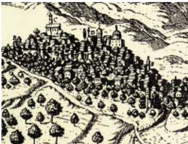
Fig. 2: Pacichelli, Veduta di Marsiconuovo (1703): particolare. Tutto quanto il complesso vescovado-chiesa-seminario viene individuato dalla lettera "D" che nella legenda corrisponde a Vescovado.

L'ennesimo terremoto, quello del 1857, rade al suolo l'intero complesso. I lavori di ricostruzione questa volta cominciano solo nel 1875 16 , con il vescovo