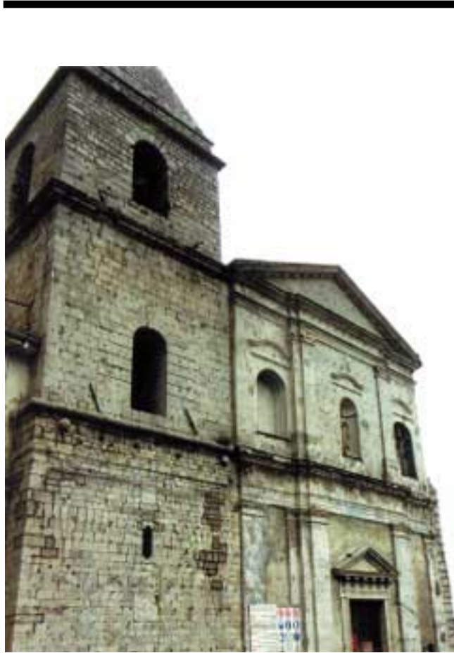
Fig. 4: Cattedrale di Marsiconuovo. Particolare della facciata, 1999

Concesso l'anticipo dal Regio Economato di Marsico, con l'invito "di aver mira a la massima economia, e li-