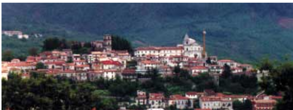
Fig. 3: Vista di Marsiconuovo, 1999. Il sito della costruzione, rimasto invariato nel corso dei secoli, a dispetto delle continue riedificazioni e ampliamenti, è sulla sommità di un rilievo costituito da una formazione calcarea, caratterizzata morfologicamente da una notevole acclività dei versanti, che coincide con il punto più alto della cittadina. Il complesso cattedrale-vescovado-seminario sono individuabili da un qualsiasi punto della vallata circostante e rappresentano il fulcro intorno al quale si è sviluppato tutto il costruito del centro storico.

La dettagliata descrizione dei lavori da effettuare sulla cattedrale risulta però insufficiente all'ing. Capo del Genio Civile al quale viene spedito il progetto dal Prefetto 27 , su richiesta del Regio Economato di Benefici Vacanti, in data 4 novembre