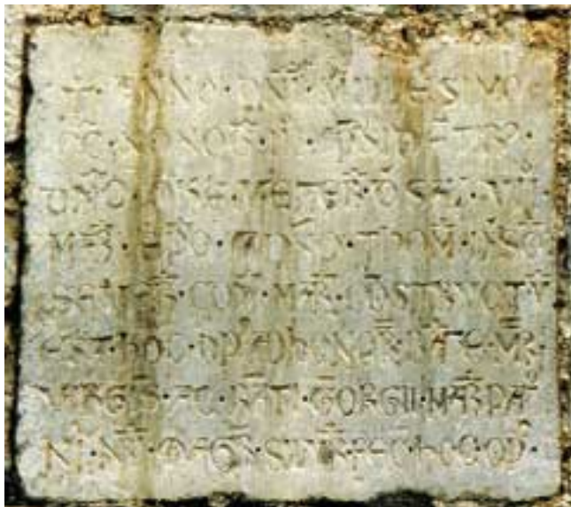
Fig. 1: Cattedrale di Marsiconuovo - Particolare del campanile. L'iscrizione murata alla base del campanile che ne indica l'anno di edificazione ed il suo costruttore. Il campanile, ricostruito più volte a causa di crolli, è dotato di due antiche campane: la più grande pesa ben 1000 kg.

Si racconta infatti che Gianuario, Vescovo di Cartagine, sbarcato a Reggio Calabria nel IV sec. d.C., passò dapprima in Abruzzo e poi in Lucania, a predicare la parola divina. Dopo Marsico, dove fu calorosamente accolto, si diresse a Potenza dove, al contrario, venne accusato di perturbare la quiete pubblica e di predicare la distruzione degli dei dell'Olimpo. Per questo, per ordine di Leonzio 12 , venne ucciso mentre tentava di fuggire da Potenza nel bosco dell'Arioso. Il suo corpo fu gettato, per disprezzo, nel tronco di un albero dove rimase fino a quando, nell'853 il vescovo Grimaldo 13 , avvertito che il suo corpo giaceva "... inorato là nel bosco dell'Arioso, fra le radici di un concavato faggio..." si recò sul luogo insieme all'abate di S. Stefa-