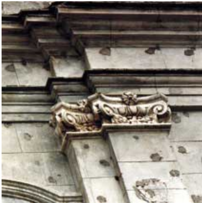
Fig. 5: Cattedrale di Marsiconuovo. Particolare della facciata: la decorazione tardo settecentesca a stucco

1864, la perizia viene però spedita dal Prefetto, con il parere positivo dell'Ingegnere capo del Genio Civile 31 , all'Ufficio dell'Economato Generale di Napoli.