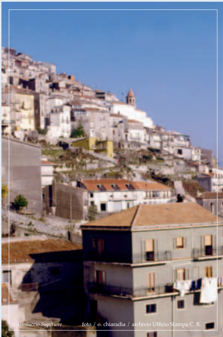
Castelluccio Superiore