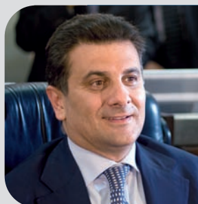
Vito De Filippo Presidente

Nato a Sant'Arcangelo il 27 agosto del 1963, laureato in filosofia, giornalista e scrittore. Dal 1990 è stato prima consigliere, poi assessore con delega alla Sanità e vice presidente della Provincia di Potenza. Eletto consigliere regionale nel 1995, ha ricoperto l'incarico di assessore all'Agricoltura e, dal 2000, è stato vice presidente della Giunta e assessore alla Sanità e presidente del Consiglio regionale. Nel 2005 e del 2010 è stato eletto presidente della Giunta regionale risultando, in entrambi i casi, il presidente più votato d'Italia.